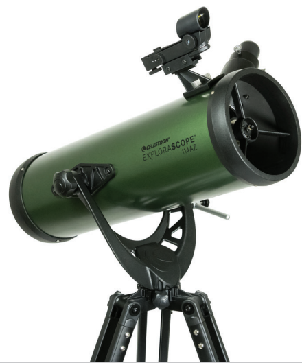
EXPLORASCOPE 114AZ Modell-Nr. 22103