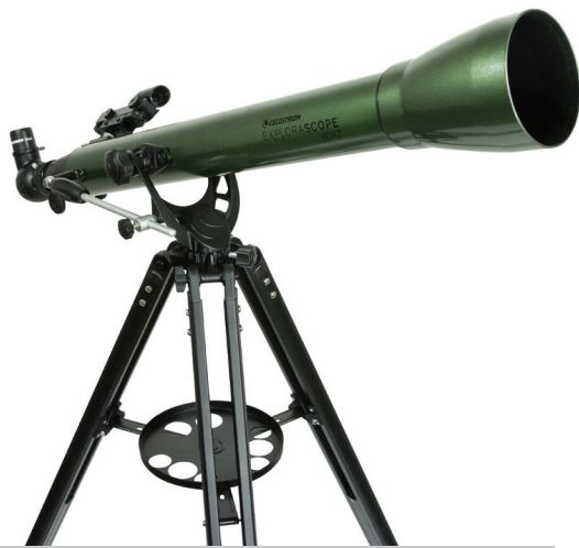
EXPLORASCOPE 60AZ Modell-Nr. 22100