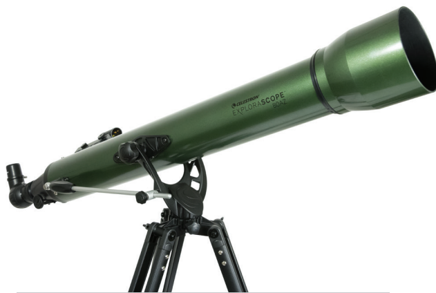
EXPLORASCOPE 80AZ Modell-Nr. 22102