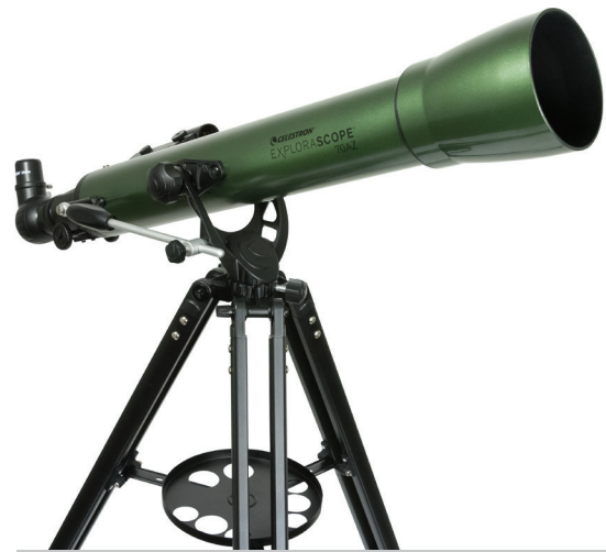
EXPLORASCOPE 70AZ Modell-Nr. 22101