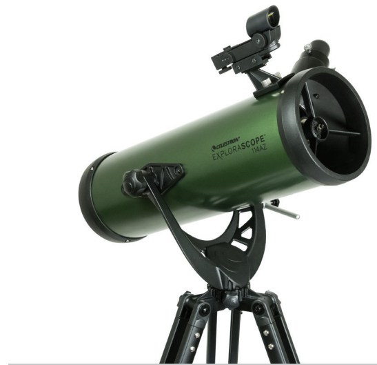
EXPLORASCOPE 114AZ Modèle n° 22103